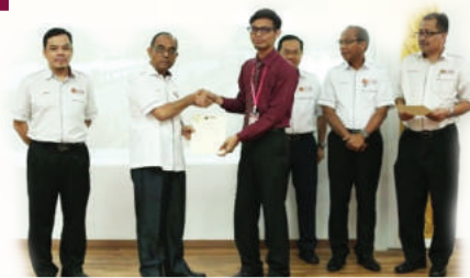
Datuk Naib Canselor UTM menyerahkan tawaran Biasiswa Endowmen Alumni UTM kepada salah seorang penerima