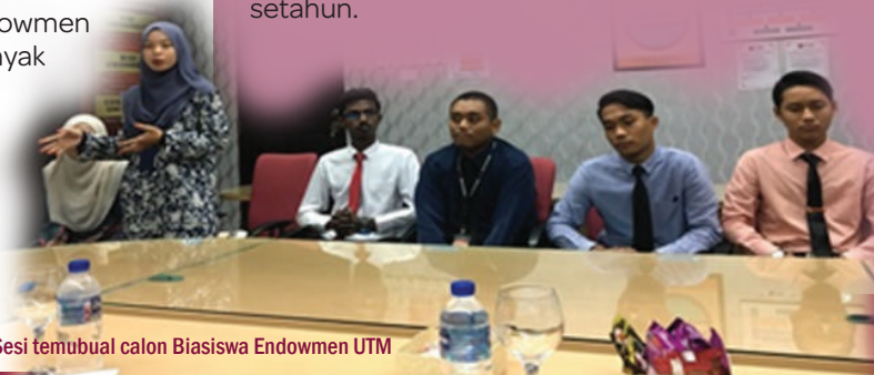
Sesi temubual calon Biasiswa Endowmen UTM

Pihak Pengurusan Endowmen UTM telah bersetuju untuk menawarkan Biasiswa Endowmen Merdeka kepada 10 pelajar baharu UTM bagi sesi 2017/2018. Sesi temubual kepada pemohon telah diadakan pada 31 Disember 2017, dan kriteria utama pemilihan adalah berdasarkan kecemerlangan dalam akademik, aktiviti kokurikulum dan latar belakang keluarga. Pemohon yang berjaya akan menerima biasiswa berjumlah RM12,000 setahun.