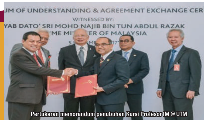
Pertukaran memorandum penubuhan Kursi Profesor IM @ UTM