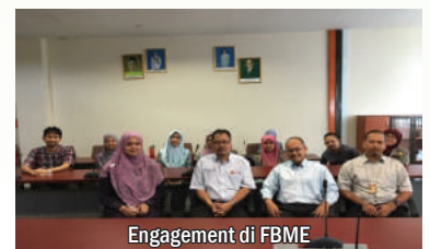
Engagement di FBME

orang staf akademik dan 277 staf bukan akademik, dengan jumlah minima sumbangan RM1 dan jumlah maksima RM1,500 sebulan. Jumlah keseluruhan sumbangan staf UTM ke Tabung Endowmen UTM melalui potongan gaji adalah sebanyak RM16,918.94 sebulan.