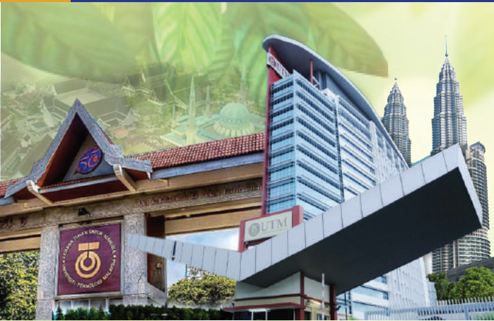
SASARAN ENDOWMEN 2017 RM20 JUTA