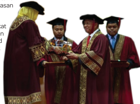
Tan Sri Azman menerima Ijazah Kehormat Doktor Kepimpinan Pengurusan daripada DYMM Canselor UTM

Penganugerahan ini merupakan pengiktirafan UTM atas sumbangan besar dan sangat bermakna yang telah diberikan oleh Tan Sri Azman kepada pembangunan masyarakat di negara ini dan sejangat. Bagi UTM, sumbangan Tan Sri Azman amat bermakna dan banyak membantu pelajar UTM yang menghadapi masalah kewangan dalam mengikuti program pengajian masing-masing dengan pengwujudan Tabung Biasiswa Azman Hashim di UTM. Tabung Biasiswa Azman Hashim yang diurus Unit Endowmen UTM mendapat sumbangan dana sebanyak RM30 juta, iaitu RM5 juta setahun selama enam tahun daripada Yayasan Azman Hashim, Amcorp Group.